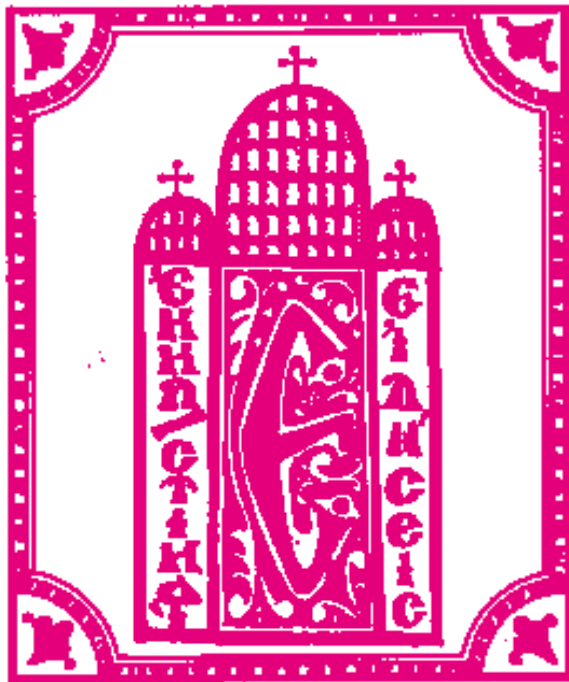
Ἐπιμέλεια: Ἱερομόναχος Καλλίνικος Κελεπούρης

11η Νοεμβρίου. Τῇ αὐτῇ ἡμέρα, ὁ Μακαριώτατος Ἀρχιεπίσκοπος Ἀθηνῶν καὶ πάσης Ἑλλάδος κ. Μακάριος μετέβη εἰς τὴν Ἱερὰν Μονὴν Ὁσίου Ἀθανασίου τοῦ Ἀθωνίτου παρὰ τοῖς Μεγάροις, ὅπου προέστη τῆς Ἀρχιερατικῆς Θείας Λειτουργίας καὶ τῆς καθιερωθεῖσης ἐπὶ τῇ ἐτησίῳ συμπληρώσει ἐπιμνημοσύνου δεήσεως πρὸς τιμὴν τοῦ μακαριστοῦ Μητροπολίτου Πειραιῶς κυροῦ Γεροντίου. Εἰς τὰς ὡς ἄνω ἱεροπραξίας μετείχον ἐπίσης μετὰ τοῦ σεπτοῦ Προκαθημένου τῆς Ἑλλαδικῆς Ἐκκλησίας μας καὶ ὁ Πανιερώτατος Μητροπολίτης Φθιώτιδος καὶ Θαυμακοῦ κ. Καλλίνικος, καθὼς καὶ ὁ Θεοφιλέστατος Ἐπίσκοπος Γαρδικίου κ. Ἀθανάσιος.