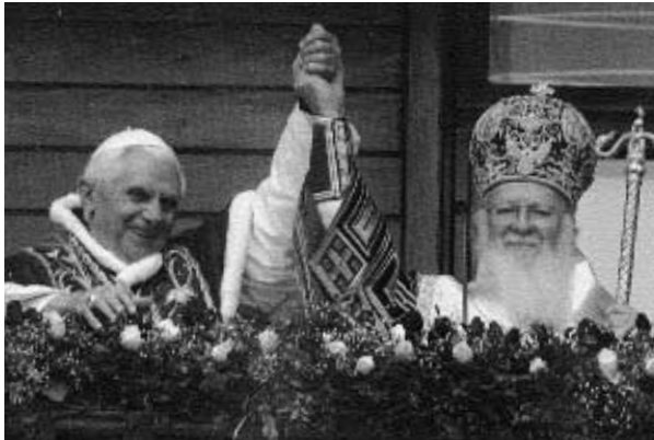
Κωνσταντινούπολις 30 Νοεμβρίου 2006.

ἄχρηστοι, μέχρι τῆς συντελείας τοῦ ματαίου τούτου αἰῶνος, καὶ αὐταὶ ἀκριβῶς εἶναι ποὺ θὰ καταδικάσουν τοὺς συγκαθημένους τῶν θεομάχων Οἰκουμενιστῶν, ψευδεβλαβεῖς, ἐν τῇ φοβερᾷ ἡμέρᾳ τῆς κρίσεως, καὶ θὰ ἀκούσουν τὸν καταδικαστικὸν λόγον τοῦ Κυρίου: «ἐκ στόματός σου κρινῶ σε πονηρὲ δοῦλε, ἦδεις ὅτι ἄνθρωπος αὐστηρὸς εἰμί ἐγώ...»! Οἱ ἄθλιοι Οἰκουμενισταὶ προχωροῦν ταχέως ἀπὸ τὴν μίαν προδοσίαν εἰς ἄλλην μεγαλυτέραν· οἱ ἡγέται των ἀρχιεπίσκοποι καὶ πατριάρχαι πρὸ πολλοῦ ἀπεκάλυψαν τοὺς ἀπωτέρους στόχους των: τὴν ἄνευ ὄρων παράδοσιν τῆς Ὁρθοδόξου Ἐκκλησίας εἰς τὸν πανθηρσκειακὸν σκουπιδότοπον τοῦ ἐπερχομένου ἀντιχρίστου.